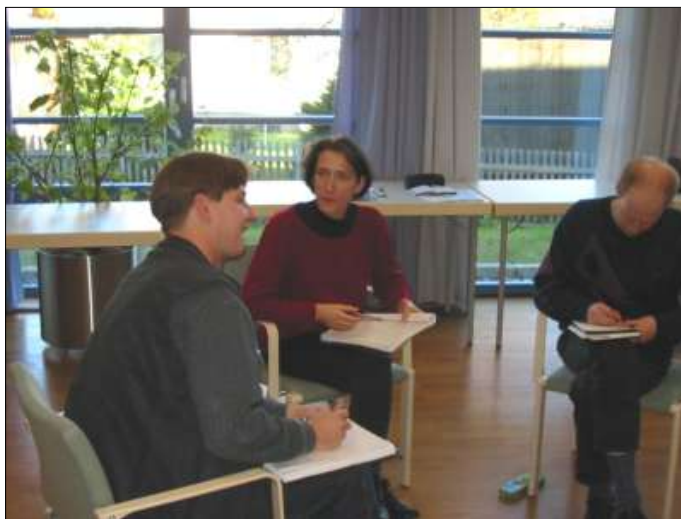
Erwachsenenbildung im Kloster Drübeck

Die religiös-kirchliche Sozialisation von Erwachsenen gerade in den neuen Bundesländern ist defizitär. 70 % bis 80 % haben überhaupt keine Verbindung zur Kirche bzw. einer christlichen Gemeinde. Es besteht jedoch durchaus ein religiöses Interesse , das vor allem gekennzeichnet ist vom Bedürfnis nach Orientierung und religiöser Bildung. Auch Fra-