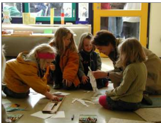
Evangelische Grundschule Gotha

Die folgenden Ausführungen nehmen unter dem Stichwort „Lebenslagen“ neben dem Lebensalter auch die soziale Lage und die tatsächlichen wie potentiellen Bildungsorte in den Blick. Dadurch erweitert sich der klassische Altersgruppenansatz. Als Voraussetzungen kirchlichen Bildungshandelns sind neben den Resten von Kirchlichkeit und dem neuem Interesse an Gemeinde und christlicher Theologie in den östlichen Bundesländern auch die vorherrschende Säkularität bzw. Konfessionslosigkeit, aber auch die zunehmende religiöse Suche jenseits konfessioneller Kirchlichkeit zu berücksichtigen. Um so mehr werden gerade von den Kirchen alltagstaugliche und sinnstiftende Antworten auf Lebensfragen erwartet.