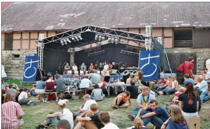
Evangelisches Jugendcamp 2005 auf Burg Lohra

werden, die jene im familiären Umfeld ergänzen und bereichern. Kinder und Jugendliche sind dabei auf Menschen angewiesen, die ihre Fragen aufnehmen, Antworten anbieten und Perspektiven öffnen. Zukunftsfähige kirchliche Bildungsarbeit muss sowohl die Lebenswirklichkeit der Heranwachsenden als auch der Familien im Blick haben.