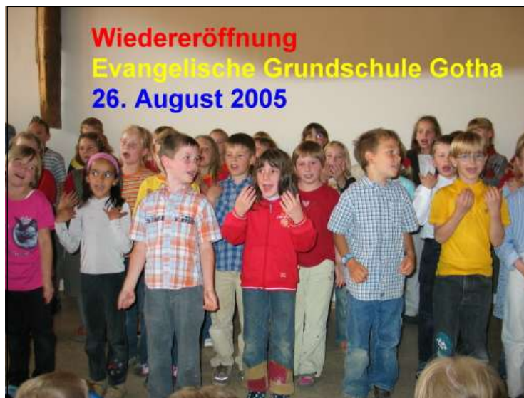
Evangelische Grundschule Gotha

sind lebendige Äußerung der gesamtgesellschaftlichen Mitverantwortung der Kirche für schulische Bildung und Erziehung. Mit ihnen besitzt unsere Kirche eine einzigartige Möglichkeit, evangelische Bildung und Erziehung umfassend zu verwirklichen. Anknüpfend an die reformatorische Bildungstradition erproben die evangelischen Schulen Wege, die für das öffentliche Bildungswesen modell-