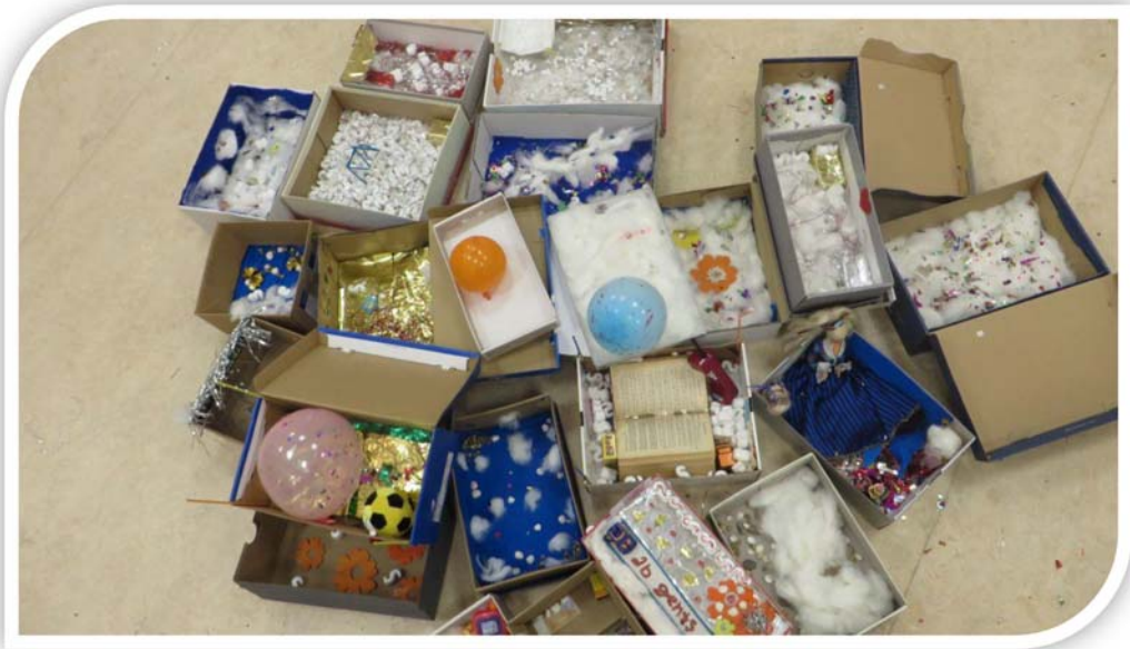
JENSEITSKISTEN DER KONFIS