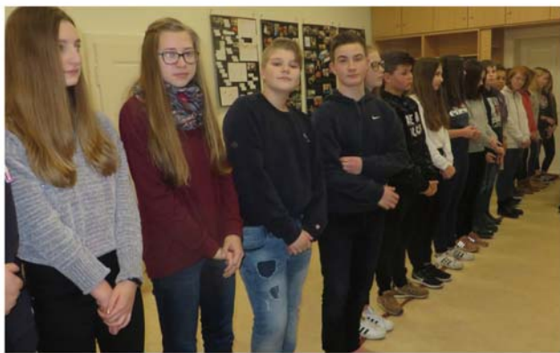
Konfis bei einem Spiel