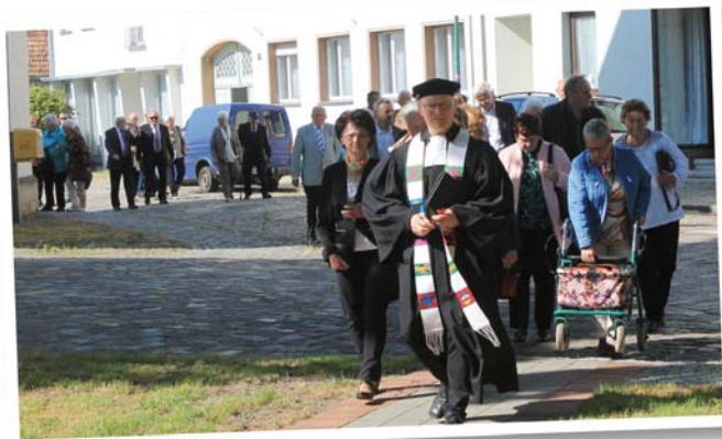
Jubelkonfirmation im Pfarrbereich