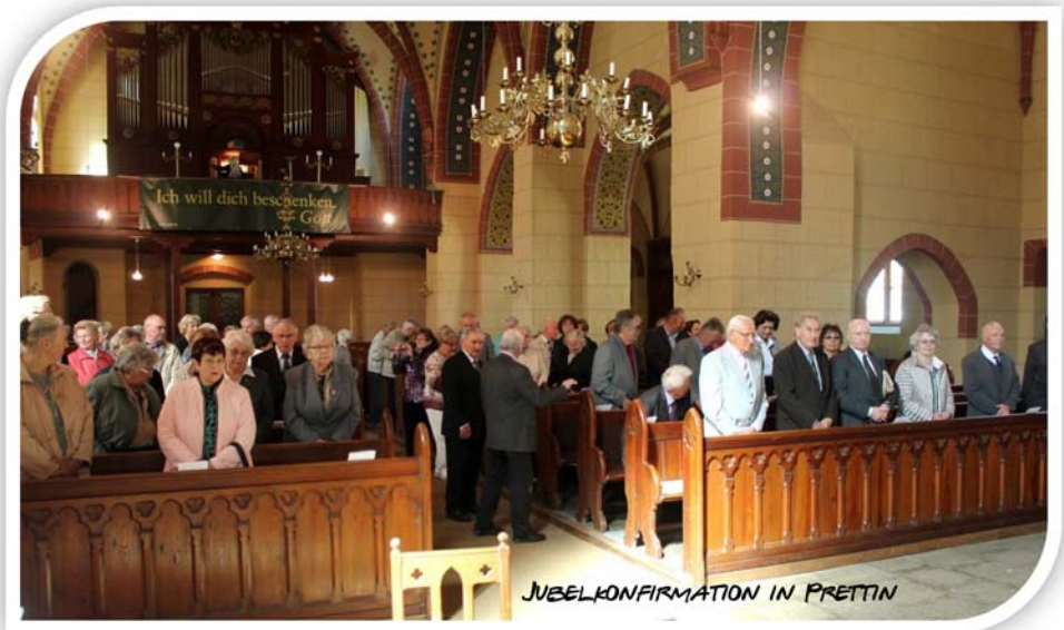
JUBELKONFIRMATION IN PRETTIN