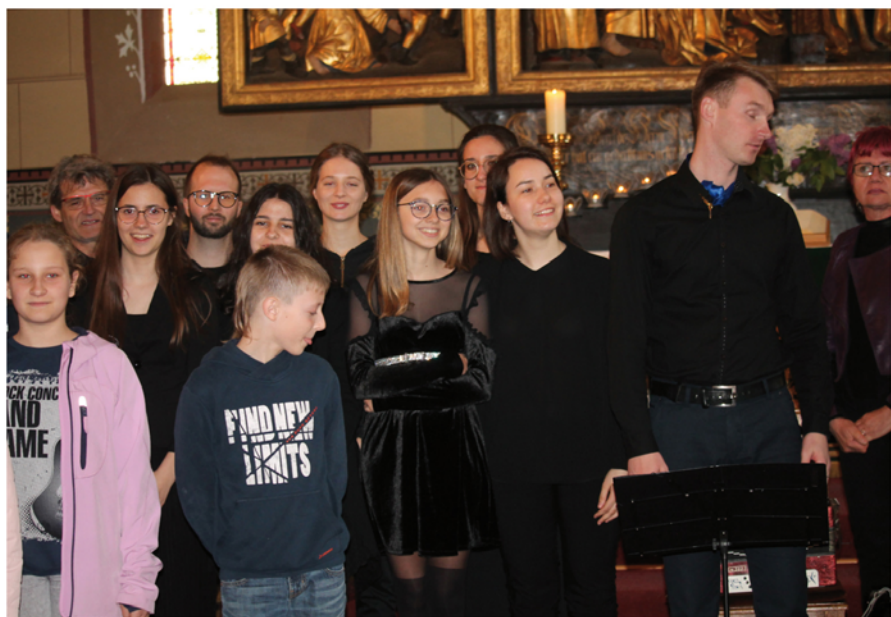
Internationales Jugendkonzert in der Stadtkirche Prettin

Informationsheft für den evangelischen Pfarrbereich Annaburg - Klöden - Prettin 14. Kirchenjahrgang Nr. 3 Juni bis August 2019